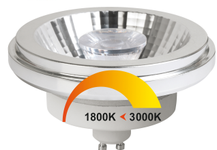
MEGAMAN® LED AR111